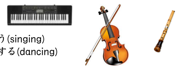
潜在意識の楽器化