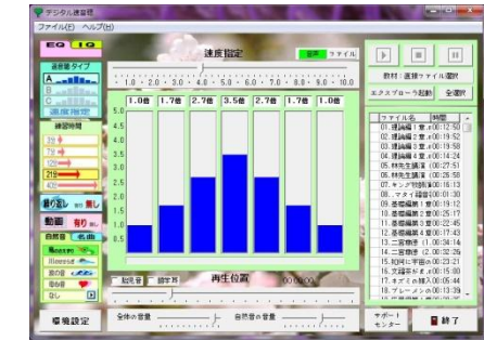
愛と才能 の開花 感性の目覚め